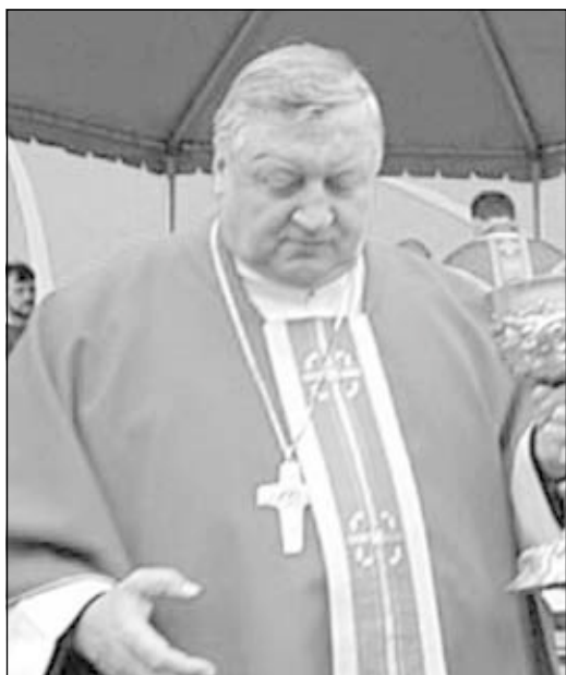
ŠKOF ALOJZ URAN, odgovorni za Slovence v zamejstvu in po svetu pri Slovenski škofovski konferenci