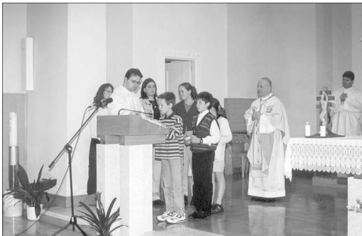
Prošnje mladih »povratnikov«

To je, dragi bratje in sestre, dolžnost nas vseh. Dolžnost slovenske vlade, dolžnost slovenske države. In če je le kaj zdrave pameti in poštenosti, bo tako kot vsak izmed nas tudi slovenska vlada storila vse, kar je mogoče, da se čim več naših rojakov vrne v svojo domovino. V njihovo veselje in v obogatitev slovenskega naroda in države. Amen.